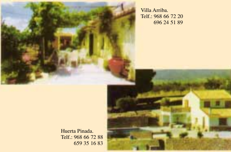
Villa Arriba. Telf.: 968 66 72 20 696 24 51 89

Por toda la Comarca y limítrofes se acondicionan casas y alojamientos rurales, se abren pequeños campings en la naturaleza o se instalan hospederías y hoteles que se caracterizan por su respeto con el medio ambiente. Las poblaciones que viven en el Parque Natural de Sierra Espuña o en sus proximidades están empezando a ver en la práctica el resultado de una oferta cada vez más completa y de mayor calidad. Existen casas rurales para turismo interior.