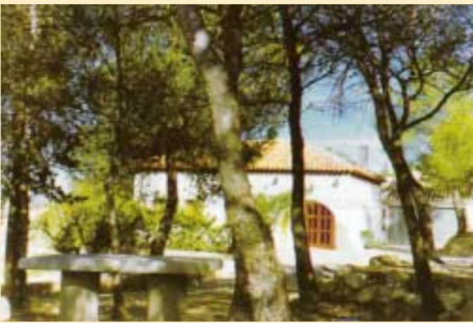
Huerta Pinada. Telf.: 968 66 72 88 659 35 16 83