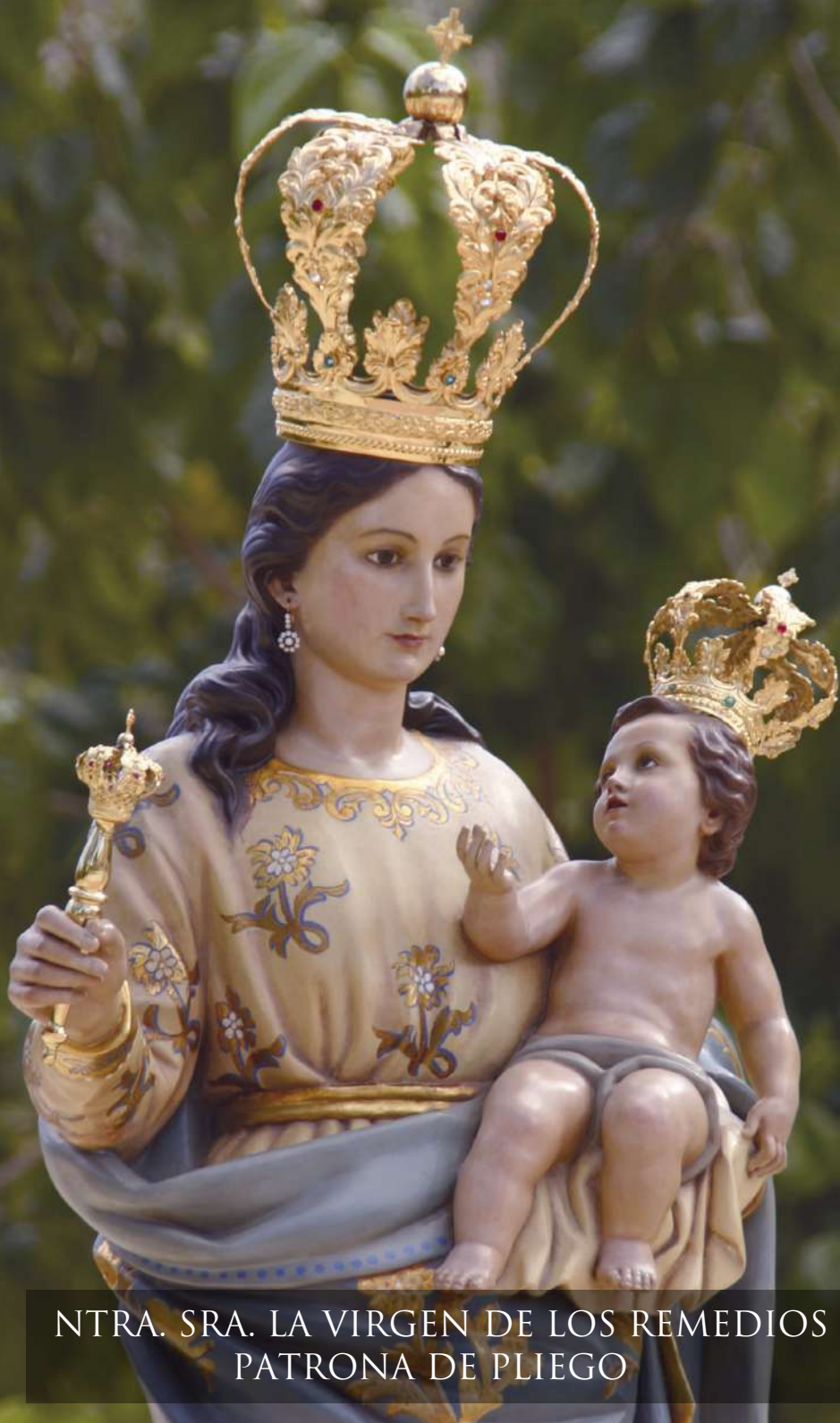
NTRA. SRA. LA VIRGEN DE LOS REMEDIOS PATRONA DE PLIEGO