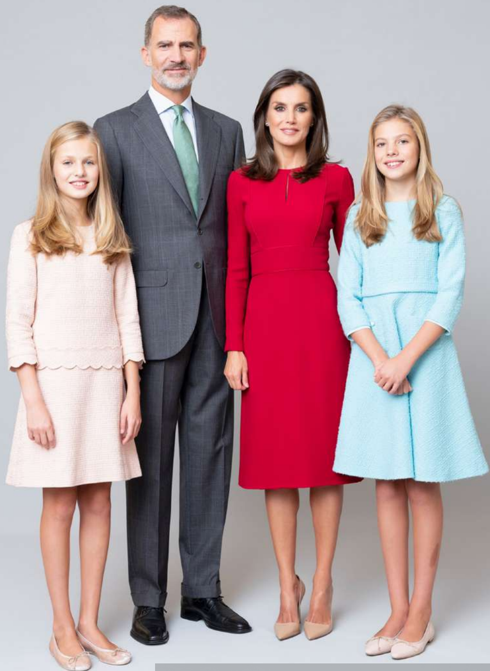
Sus Majestades los Reyes de España